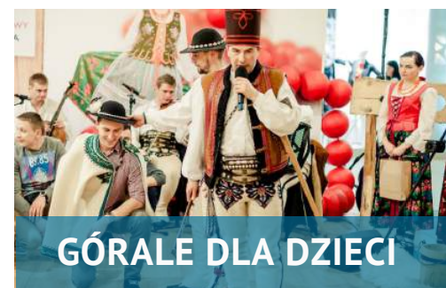
GÓRALE DLA DZIECI

Klub Pingwina po nartach - popołudniowe zajęcia